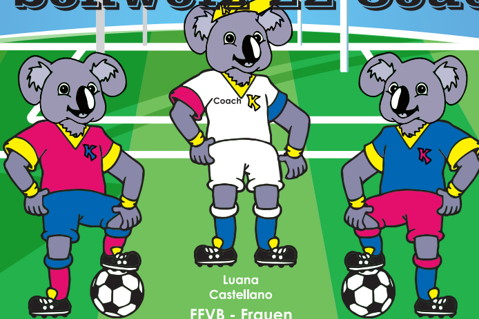
Luana Castellano FFVB - Frauen

Fussball Basics - Fussball Tricks - Fussball Match